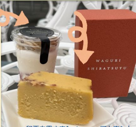
和栗白露さまInstagramアカウント

マロンクリーム、生クリーム、和栗の葛ねり、いちごのコンフィチュールの4つの層で構成されています。マロンクリームの中にはいちごの果肉が練りこまれており、つぶつぶとした食感を楽しんでいただけます。和栗本来の、濃厚で優しい甘味といちごの爽やかな酸味がベストマッチ！口いっぱい幸せが広がります…♡SSLメンバーのオススメは、豪快に縦にスプーンを入れて、すべての層を一気に味わう食べ方！それらが抜群のコンビネーションで「魅せて」くれます。冷凍状態での販売なので、解凍しきつてしまう前に食べてもシャキシャキとした食感を楽しめますよ！