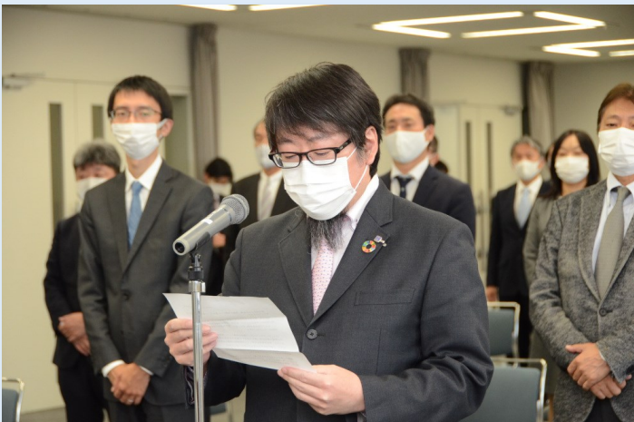
2020年12月 いしかわ男女共同参画推進宣言企業認定書交付式

新年あけましておめでとうございます。旧年中は格別のご高配を賜り、心より御礼を申し上げます。皆様のご要望にお応えできるよう、社員一同気持ちを新たに努力してまいります。本年も変わらぬご指導ご鞭撻を賜りますよう宜しくお願い申し上げます。