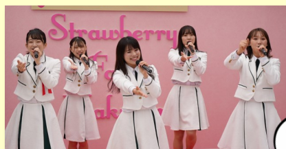
ほくりくアイドル部の皆さんによるミニライブ

「木綿のハンカチーフ」と当社CMソング「輝く未来へ」の2曲を披露していただきました！